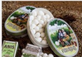
Les anis de Flavigny