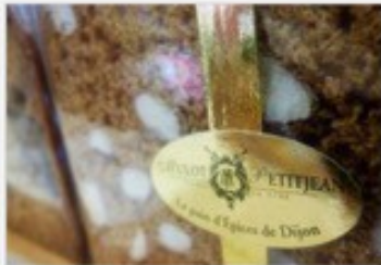
Le pain d'épices