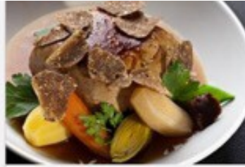
La truffe de Bourgogne