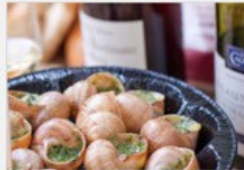
Escargots de Bourgogne