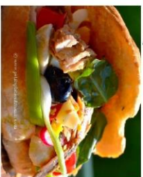
Le pan bagnat