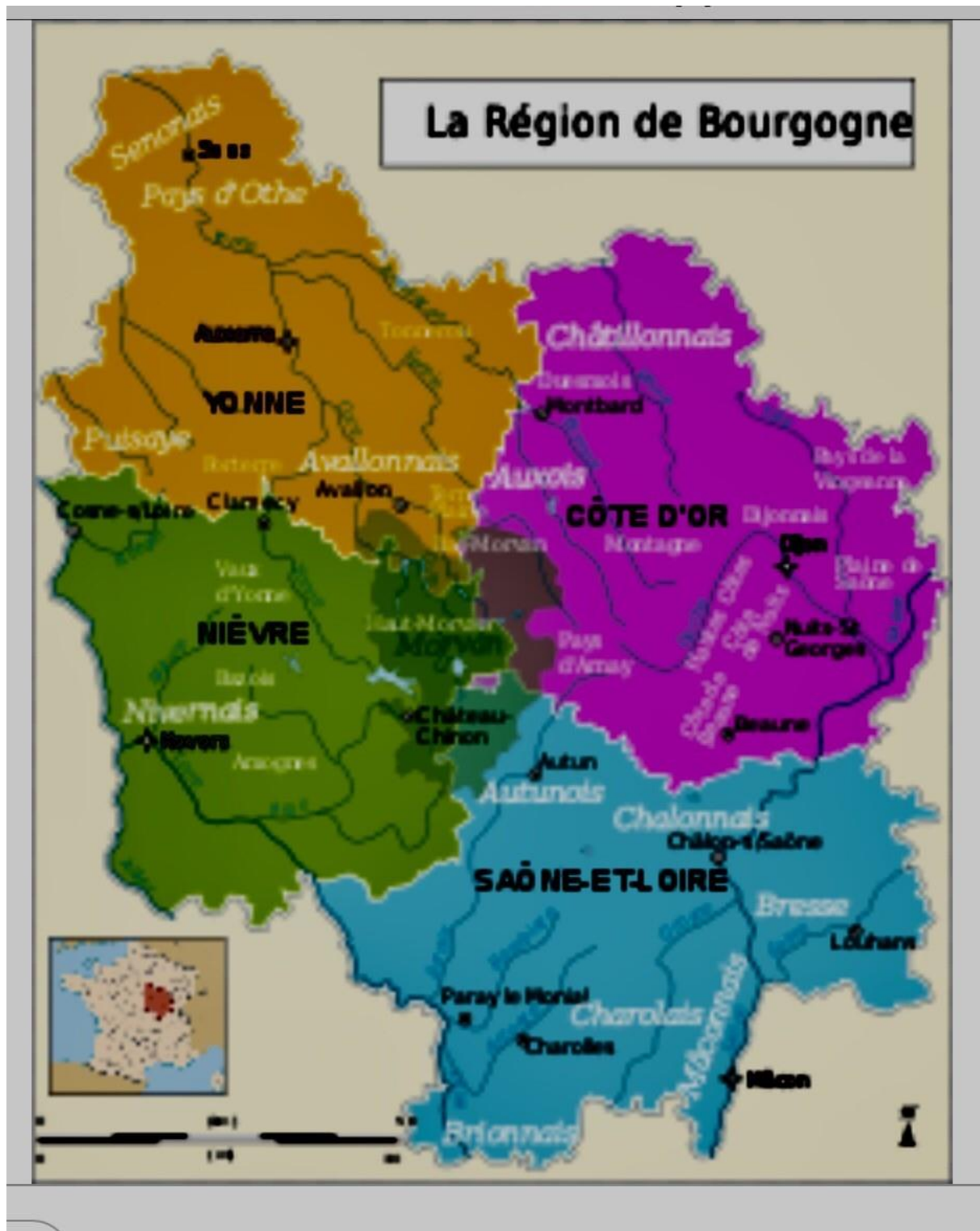
Carte du département de la Côte d'Or : cherchons Semur-en-Auxois